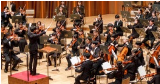
北海道大学交響楽団